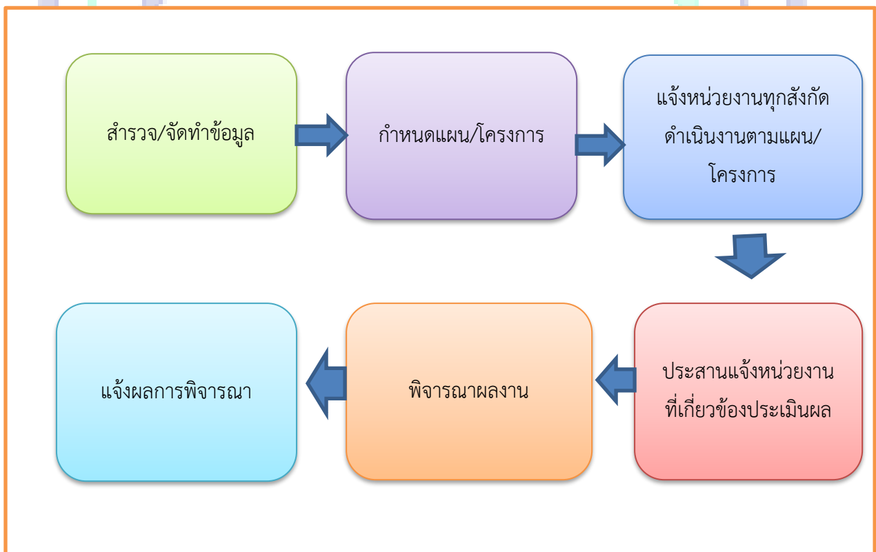
Flow Chart การปฏิบัติงาน