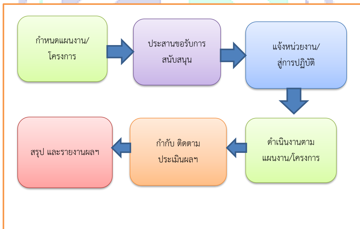
Flow Chart การปฏิบัติงาน