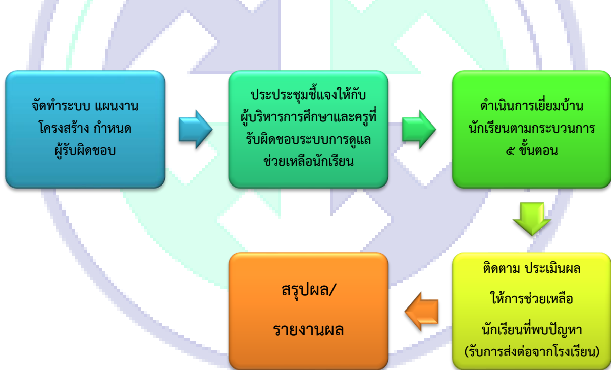
Flow Chart การปฏิบัติงาน